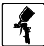
Air Spray Ready