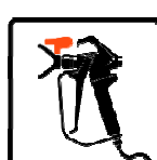
Airless Ready to Spray