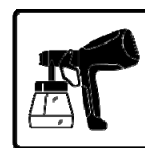
HVLP Ready to Spray