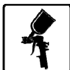
Air Spray Ready