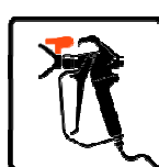
Airless Ready to Spray