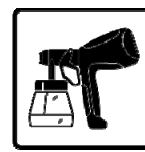
HVLP Ready to Spray